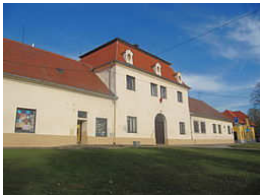
Památkově chráněný zemědělský dvůr č. p. 9, dnes obecní úřad

Domanín (německy Domaning) je obec v okrese Hodonín v Jihomoravském kraji, 9 km severozápadně od Veselí nad Moravou. V roce 2010 zde žilo 1 017 obyvatel. První písemná zmínka o obci pochází z roku 1220. V obci se nachází základní a mateřská škola.