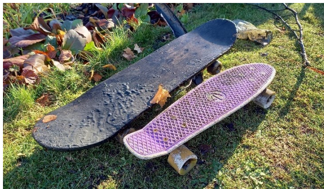
„Poklady“ nalezené v rybníce