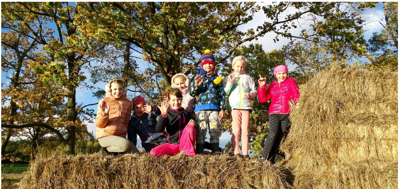
Spolek Domanínských maminek