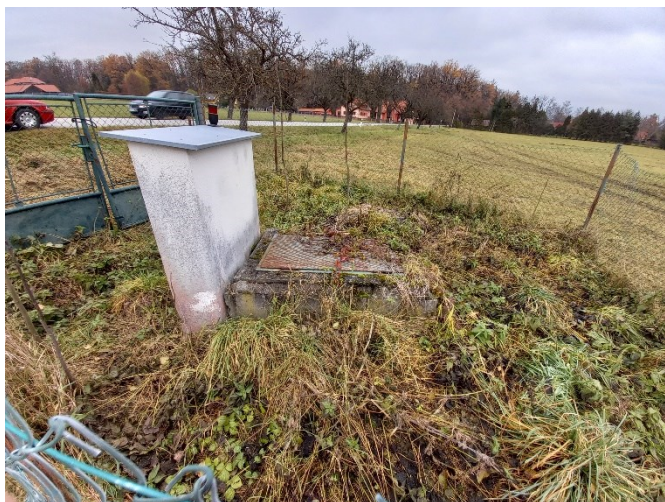
Stav PŘED – původní plot