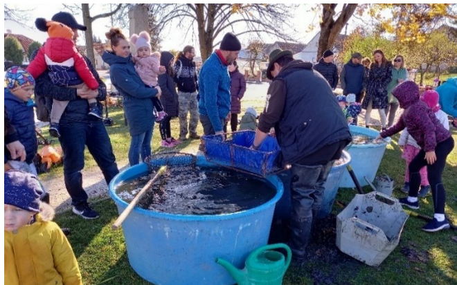
Třídění ryb ze Stávku do kádí