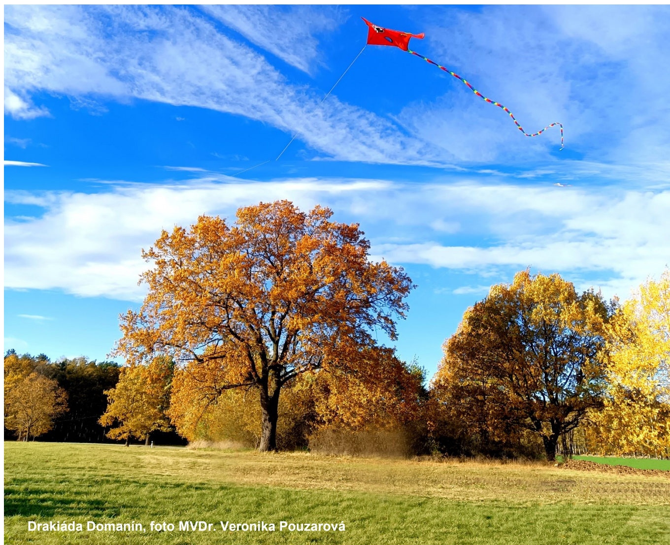
Drakiáda Domanín