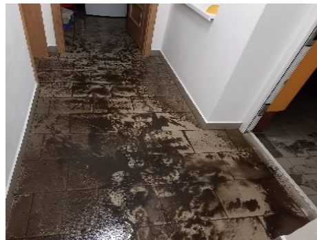
Foto ze srpna 2023, kdy se do hasičské zbrojnice dostala splašková voda

Důvodem je, že se do hasičské zbrojnice v případě větších dešťů tlačily splašky z obecní kanalizace, což nebylo kupodivu několik let řešeno. Za tu dobu poničila splašková voda především nábytkové vybavení zbrojnice a obložkové dveře.