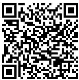
QR kód Domanínský zpravodaj on-line