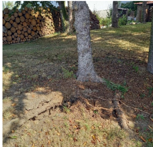
Smrk v parku pod bytovkami s narušenou stabilitou v kořenovém systému

Letošní rok je pro domanínské hasiče pestrý a velmi náročný. Za jejich nasazení a pomoc jim velmi děkuji.