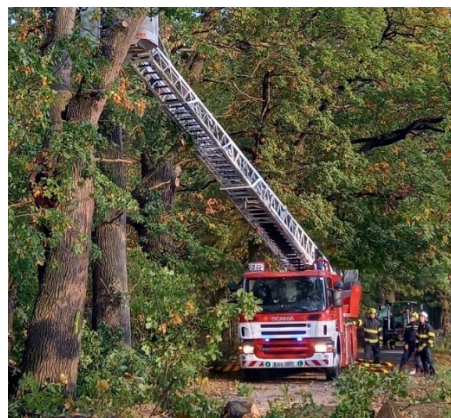
Hasiči ořezávají z automobilového žebříku nebezpečný dub u Prostředního rybníka

Padlé stromy ze silnic ještě v noci odstranil Sbor dobrovolných hasičů Domanín. Na dva velké poškozené a velmi rizikové duby musel být pozván Hasičský záchranný sbor Jihočeského kraje z důvodu potřeby výškové techniky.