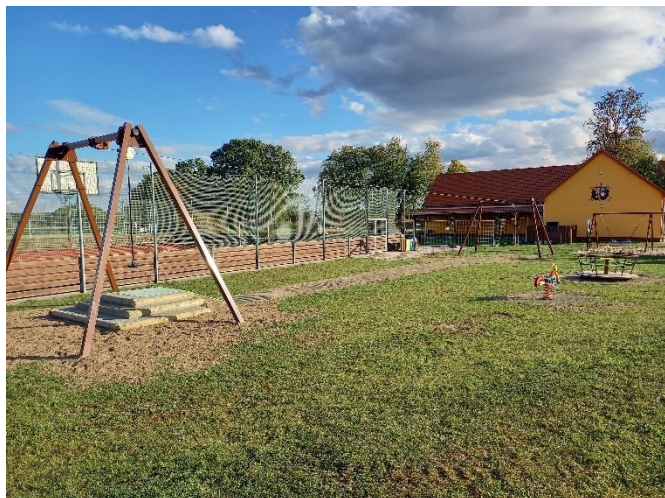
Nová nástupní plošina u lanové dráhy a nové dopadové plochy ze zatravněvacích rohoží