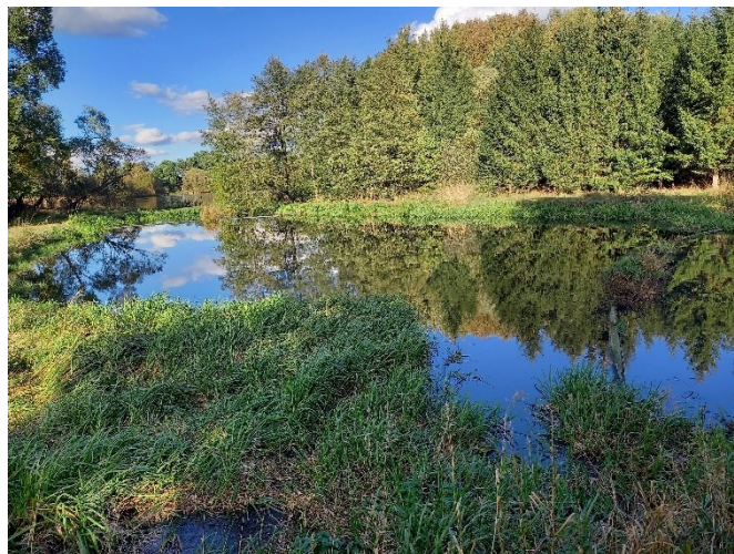
Stabilizační nádrž ČOV, jejíž odbahnění se plánuje na rok 2024

Projektovou dokumentaci budou zpracovávat a povolení vyřizovat dle smlouvy o dílo do konce března 2024. Následovat bude výběr zhotovitele, který provede samotné odbahnění stabilizační nádrže. Rovnou s tím se vyčistí i čtyřkomorový septik, na který již běžný fekální vůz nestačí. Odtěžený sediment ze stabilizační nádrže bude uložen rovnou na zemědělskou půdu – provedené vzorky prokázaly, že uložení sedimentu je na zemědělskou půdu možné. Tím, že vzorky vyšly dobře, se nebude muset odtěžený sediment odvážet jako nebezpečný odpad na skládku a obec Domanín výrazně ušetří. Dotace na akce tohoto typu nejsou, protože se jedná o součást vodohospodářské infrastruktury obce, nikoliv o klasický rybník.