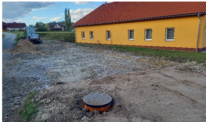
Přeložená kanalizační přípojka od hasičské zbrojnice ve správném spádu s šachtou osazenou zpětnou klapkou

Kanalizační přípojku jsme nechali přeložit a prodloužit s napojením do obecní kanalizace v nižším bodě. Malá šachta se zpětnou klapkou byla na přípojce též zřízena.