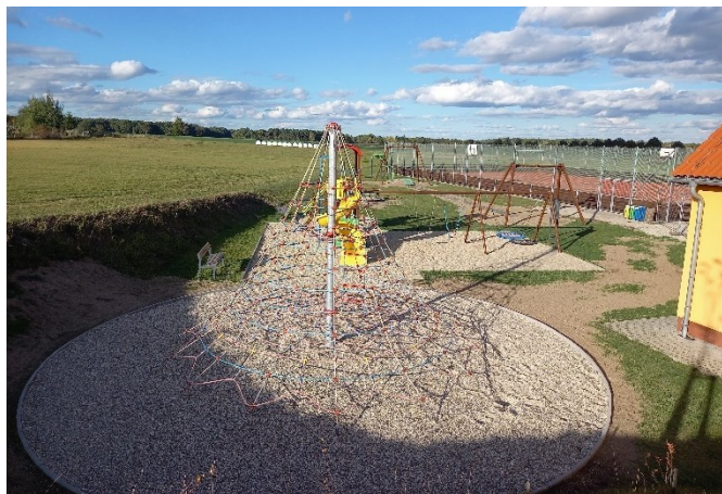
Nová dopadová plocha pod lanovou pyramidou, díky níž se zde nebude držet voda a zároveň se bude lépe udržovat (bez nutnosti sečení křovinořezem pod lany)

Stavební činnost ve víceúčelovém sportovním areálu je v plném proudu. Dětské hřiště je kvůli tomu dočasně mimo provoz. Práce budou dokončené během listopadu. Těšit se můžeme na upravené vnitřní komunikace, nové sedací sestavy pod pergolou a děti pak na nové dopadové plochy pod herními prvky. Akce je podpořena dotací od Jihočeského kraje.