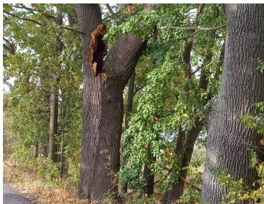
Vichřicí poškozený dub u Prostředního rybníka

V úterý 3. října večer okolo 22. hodiny postihla naši obec další bouřka a vichřice, která tentokrát zapříčinila hlavně pády a polomy stromů. Ty spadly na silnice směr Mladošovice, Kojákovice a Spolín, podél stezky na koupaliště, na cestu na Odměny, na Vrších a podél cesty na Brannou u Prostředního rybníka.