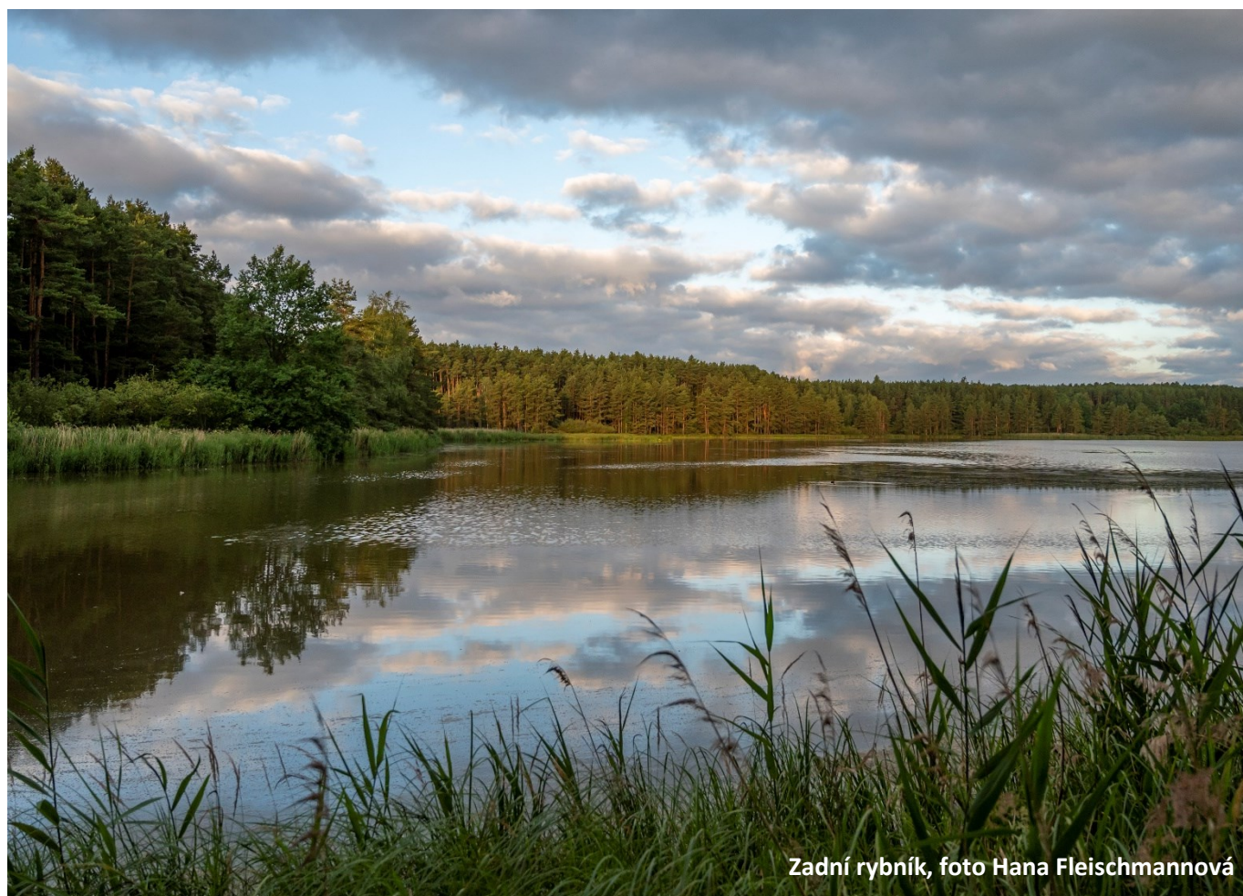
Zadní rybník, foto Hana Fleischmannová