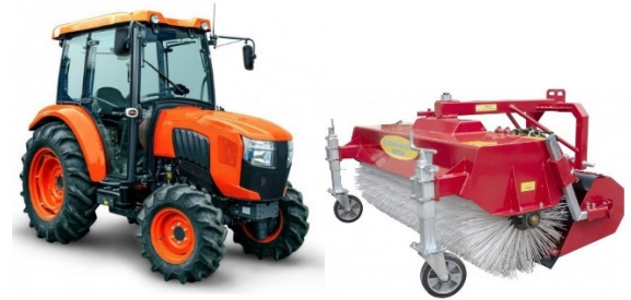
Ilustrační foto komunální techniky

Komentář: V případě získání této dotace plánuje obec pořídit techniku na údržbu veřejných prostranství – malotraktor a nástavbami, jako jsou čelní nakladač, zametací kartáč, radlici na prohrnování sněhu, sypač pro posyp místních komunikací a chodníků, svahový mulčovač s bočním výsuvem na mulčování travnatých ploch i příkopů a kontejner.