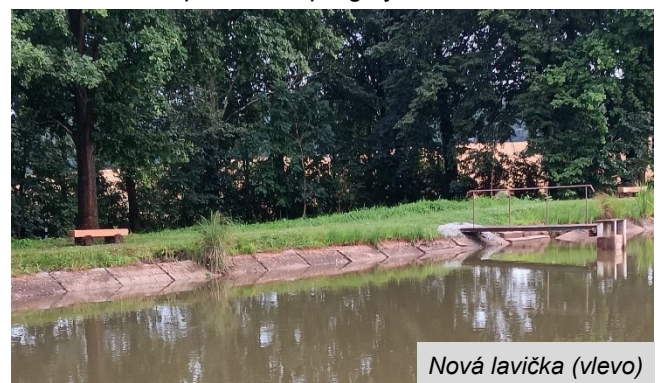
Nová lavička (vlevo)

K rybníku byly doplněny nové lavičky s dubovými sedáky a tlakově impregnovanými „nohami“ – dvě k belu a dvě k pláži u pergoly.