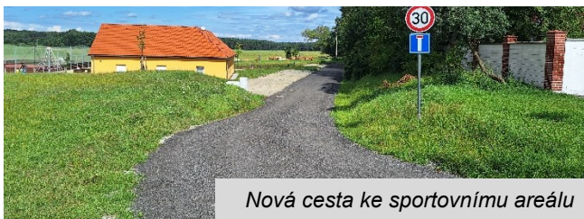
Nová cesta ke sportovnímu areálu

Ve sportovním areálu byla zhotovena cesta z asfaltového recyklátu. Recyklát je vhodnější než prašný povrch, který především v prudkém svahu odplavovala voda.