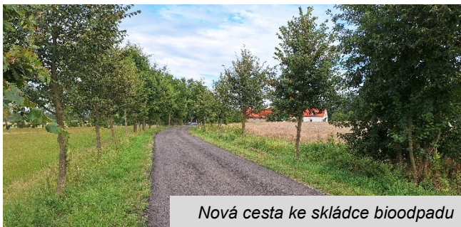
Nová cesta ke skládce bioodpadu

Na cestě ke skládce bioodpadu (trávy, listí a větví) byl položen nový povrch z asfaltového recyklátu. Cesta tak bude snadno sjízdná i po zimě či po větších deštích a vydrží větší zátěž než cesta prašná, ve které se často tvoří díry a výtluky a která vyžadovala téměř každoroční opravy.