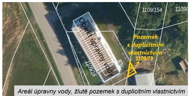
Areál úpravný vody, žlutě pozemek s duplicitním vlastnictvím

Komentář: Jedná o pozemek v areálu úpravný vody, na kterém je v katastru nemovitostí zapsané duplicitní vlastnictví obce Domanín a soukromé osoby. S tou se nám podařilo vyjednat, že se pozemku vzdá ve prospěch obce Domanín.