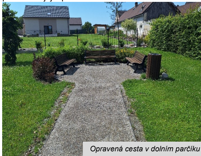
Opravená cesta v dolním parčíku

Mlatová cestička v malém parčíku v dolní křižovatce si od doby své realizace „sedla“ a po deštích se zaplavovala vodou, přerůstala trávnikem a celkově se v ní uchycovaly mechy a plevely. Z tohoto důvodu byla provedena její oprava a mírné zvednutí.