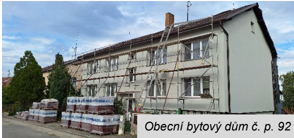
Obecní bytový dům č. p. 92

Komentář: Podařilo se získat dotaci na rekonstrukci střechy na obecním bytovém domě č. p. 92. Celkový rozpočet činí 850 tis. Kč vč. DPH, dotace pokryje přes 30 % nákladů. Rekonstrukce střechy již probíhá.