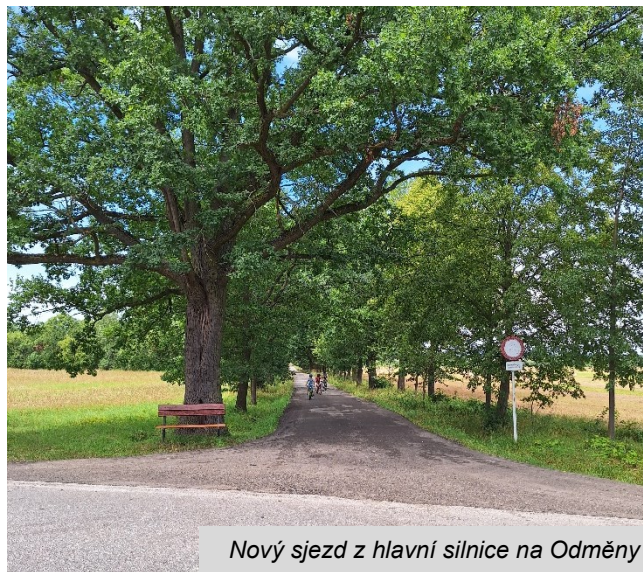
Nový sjezd z hlavní silnice na Odměny

Z recyklátu jsme nechali opravit i sjezd z hlavní silnice na Odměny, který byl prudký a vyplavovala jej voda.