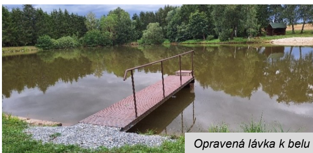
Opravená lávka k belu

Na rybníku Novém byla opravena lávka k belu. Z tohoto důvodu musela být hladina rybníka snížena o cca 70 cm. Díky červencovým deštům je již rybník téměř na normálním stavu.